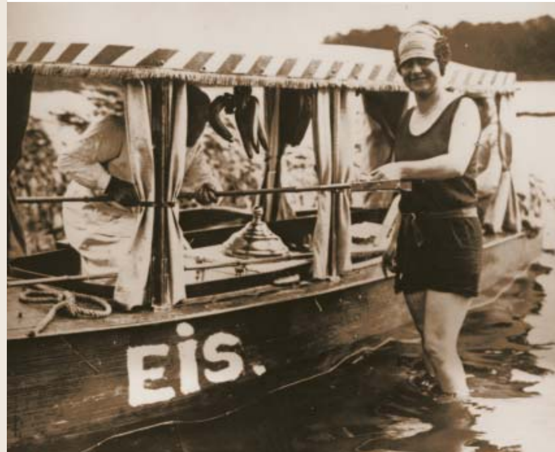
Eisverkauf im Wannsee, Berlin um 1900

Aber selbst Anfang der fünfziger Jahre waren die Deutschen vom heute gewohnten Eisgenuss zu Hause aufgrund fehlender Kühlmöglichkeiten noch weit entfernt. Erst 5,3 Prozent aller Haushalte besaßen einen Kühlschrank. Dafür blühte das Kiosk- und Straßengeschäft. Geliefert wurde das Eis in Thermosbehältern, die Kühlung erfolgte mit Trockeneis. Mit der Verbreitung elektrischer Tiefkühlschränke wurden die technischen Voraussetzungen für den nun rasch wachsenden Eisabsatz geschaffen. So stieg der Pro-Kopf-Verbrauch der Deutschen in den vergangenen 40 Jahren von 1,5 Litern auf rund 8 Liter im Jahr.